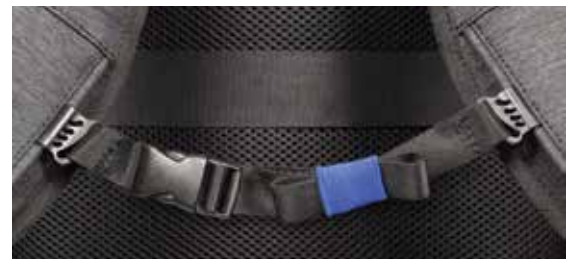
Adjustable pectoral belt Sangle pectorale ajustable