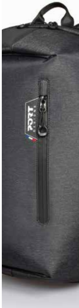
Front easy access pocket Poche avant facile d'accès