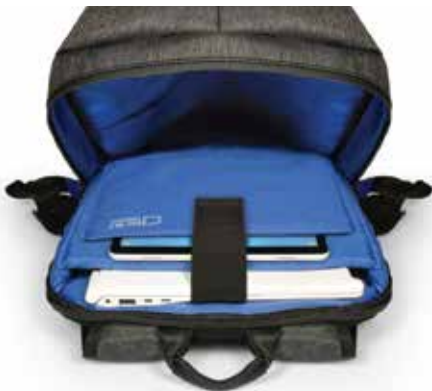
Laptop / tablet compartments Compartiments laptop / tablette