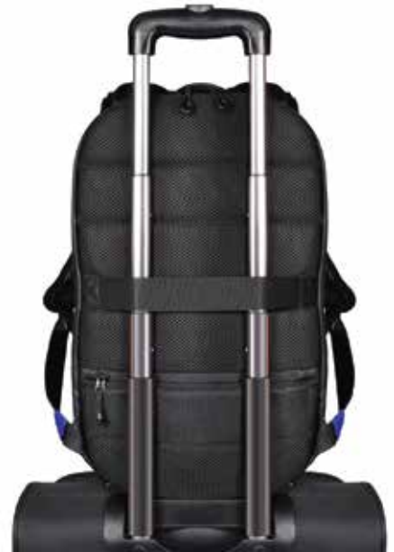
Trolley strap Sangle de trolley