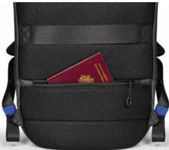
Secret back pocket for smartphone and accessories Poche arrière secrète pour smartphone et accessoires