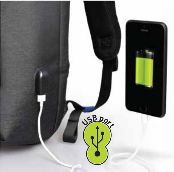
Integrated USB port to charge your devices anywhere Port USB intégré pour charger vos appareils n'importe où