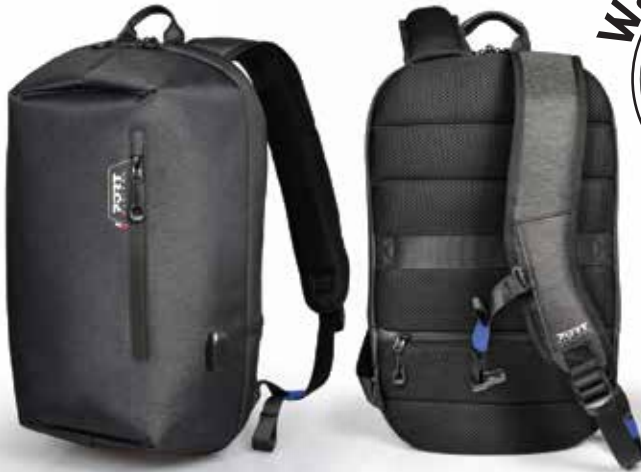
Elegant and water repellent design Design élégant et imperméable